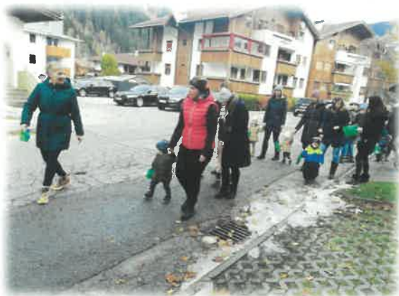
Laternenumzug EKIZ Zell am Ziller